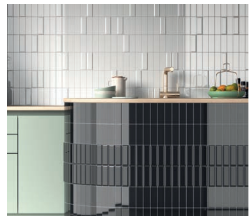
Mayolica, Ikon (5x15 cm)