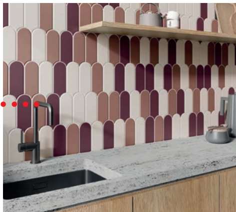
Decocer, Pantone (8x21,5 cm)

Desde formas clásicas como cuadrados y rectángulos, pasando por formatos hexagonales o triangulares hasta diseños vanguardistas, saber jugar con los diferentes tamaños y formatos de baldosas cerámicas nos ayuda a conseguir el aspecto que deseamos en nuestro hogar.