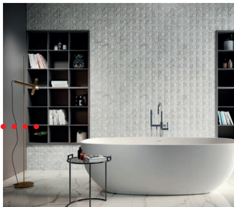
El Molino-Hijos de Cipriano Castelló, Minerva (20x60 cm)

Esta opción de optar por baldosas con relieves favorece la creación de espacios más confortables a través del efecto táctil que ofrecen sus superficies, además nos permiten incrementar la sensación de bienestar y calma de los espacios.