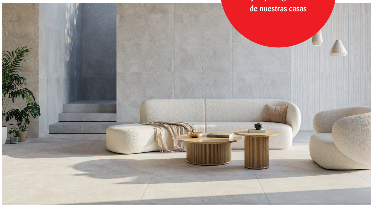
Ibero, Lune (60x120, 90x90, 60x60, 30x90 y 28,5x29 cm)

La cerámica lo tiene todo para ser el aliado perfecto y el protagonista de nuestras casas