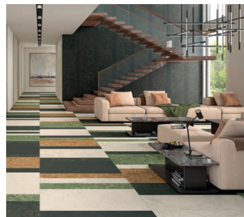
Arcana Cerámica, Black&Cream (120x120, 60x120, 19,4x120, 80x80, 60x60, 59,3x59,3, 28,6x28,6 y 24,3x24,3 cm)