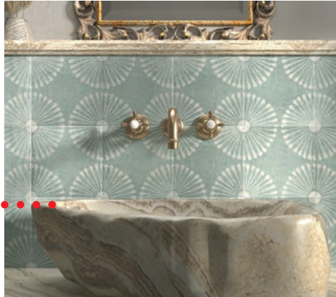
Mainzu, Carino (20x20 cm)

Combinando baldosas diseñadas con gráficos llamativos con superficies y elementos en colores planos y uniformes, conseguiremos acabados elegantes y únicos.