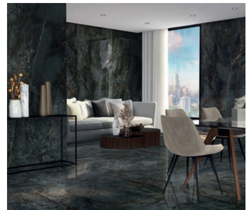
Etile, Manhattan (60x120, 120x120 y 260x120 cm)