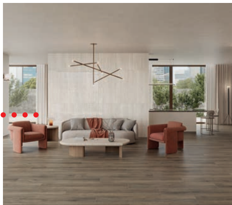
KTL Cerámica, Uppsala (30x150 cm)

Podemos utilizar cerámica de inspiración madera para crear una atmósfera relajante que nos aporta serenidad o utilizar baldosas de inspiración piedra que nos ofrecen un resultado sofisticado e impactante.