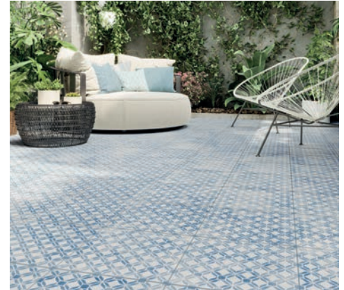
Realonda, Fresco (32,9x32,9 cm)