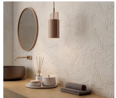
Emotion Ceramics, Amira (100x100, 60x120, 60,5x60,5, 60x60, 45x45, 30x90, 33,3x33,3 y 20x60 cm)